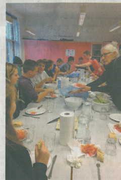
Forløbet om Nexø Havn blev afsluttet med et ordentligt rejlegilde – midt i klasselokalet.