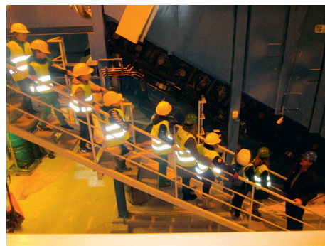
Skolelever på besøg hos BOFA og ved lagersortering i Kvickly